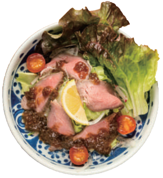
低温調理した 自家製ローストビーフ のサラダ 650