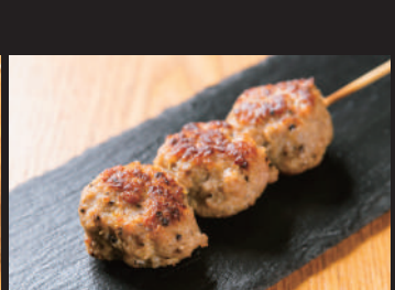
しょうばくてウマイ!! うま塩豚つくね [1本] 250