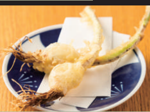
海老天「2尾」 240 キス天「2尾」 280 しいたけ天「2ヶ」 260 チーズ天「2ヶ」 260 芽と根の付いた 乙姫にんにく天 [2本] 300