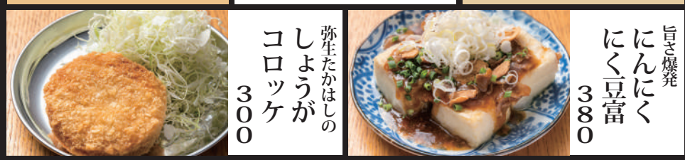
旨き爆発 にんにくにんにく 380 弥生たかはしの しょうが コロッケ 300 パリパリ麺の なら豚 皿うどん 580 とろろ煮込んだ ラフテー エッグ 390