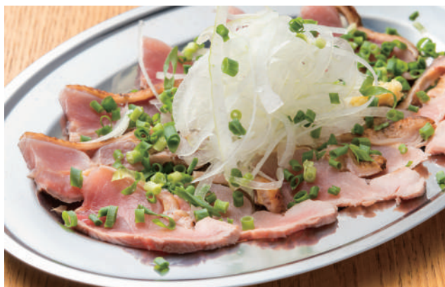
さつま赤鶏のたたき 580