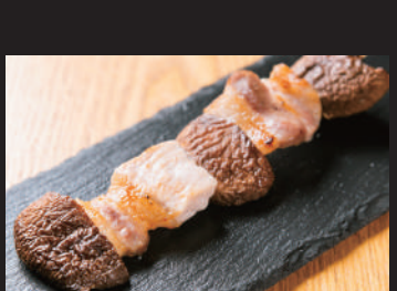
米の恵み豚使用 県産豚ロースとしいたけ [1本] 250