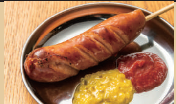
チリドッグ風の ジャンボフランク [1本] 220