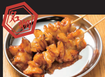
超!超!脂ののった 大トロホルモン [1本] 180