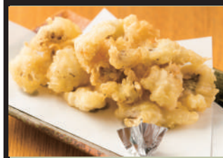
海老2尾入り 塩とレモンでどうぞ イカゲソ天 380