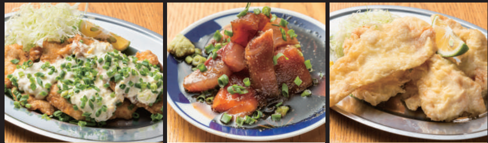
かぼすタルタル チキン南蛮 480 薄利感謝 りゅうきゅう 200 かぼすポン酢でいただく とり天 380