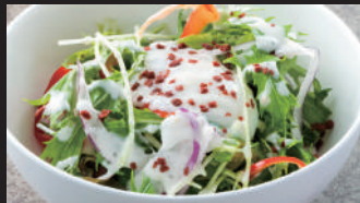
温玉シーザーサラダ