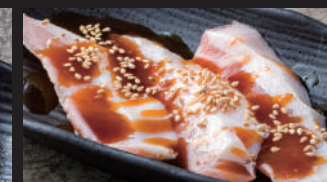
ピートロ [タレ・スパイス塩]