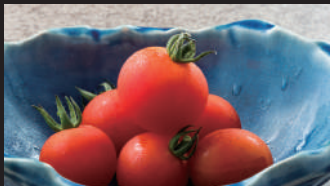
県産朝採れミニトマト