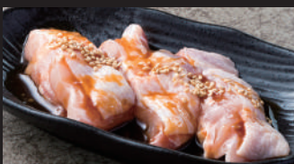
鶏もも [タレ・スパイス塩・赤辛]