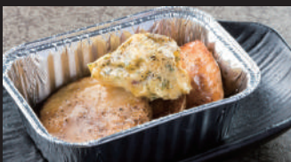
じゃがバタホイル焼