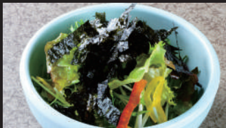
のりのりチョレギサラダ