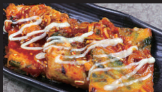
チーズ揚げチヂミ