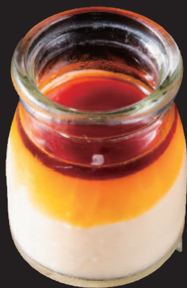
なめらかキャラメルプリン

ソフトクリーム、 アイスクャンディは、 ドリンクバー横の セルフコーナーに ございます。