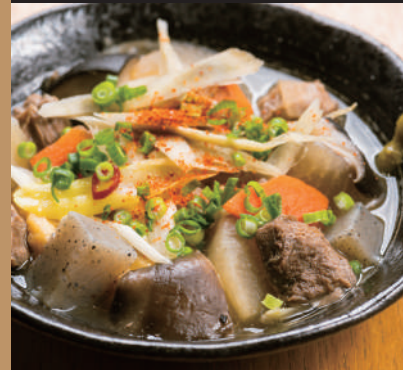
牛ホルモンの 煮込み 580円