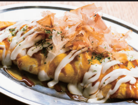
お好み焼風オム焼き 580円