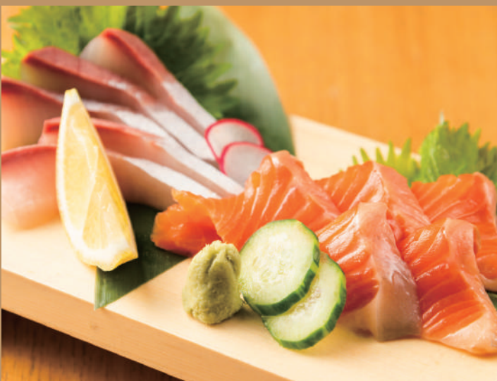
本日の刺身 2点盛り 580円 本日の刺身 2点(倍)盛り 980円