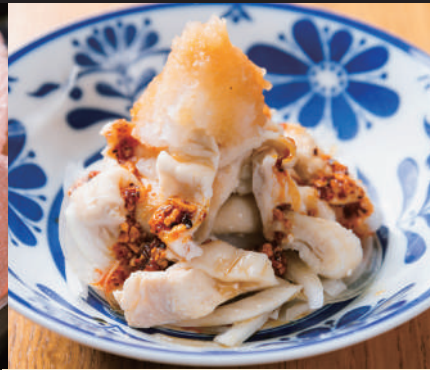
鶏皮ポン酢 旨辛辣油仕立て 380円