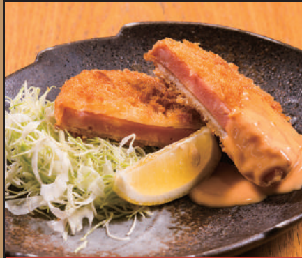
昭和厚切りハムカツ 【1枚】 200円