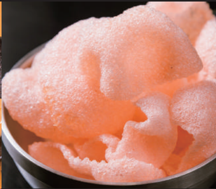
揚げたて えびせん 200円