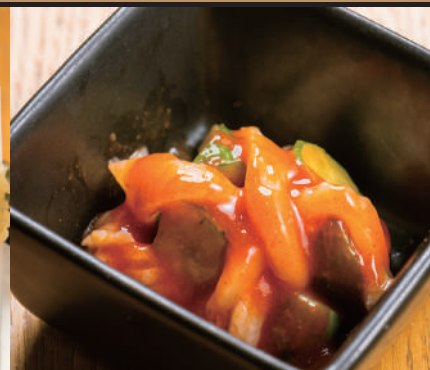
イカ刺しときゅうり のキムチ 380円