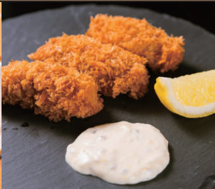
広島産 カキフライ [3個] 450円