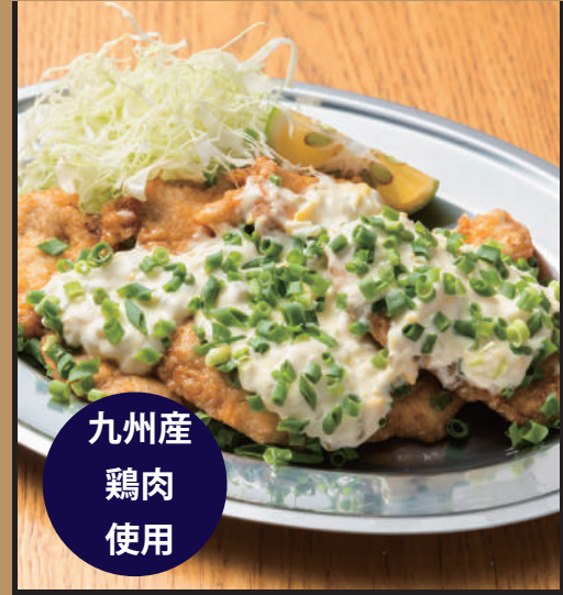
九州産 鶏肉 使用