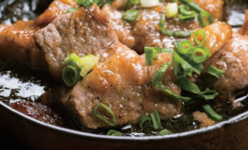
酒場の 鉄板ビーフ ステーキ 880円