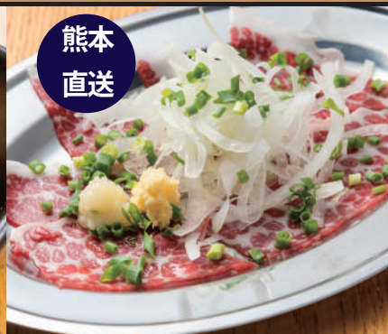
馬刺しの薄造り 650円