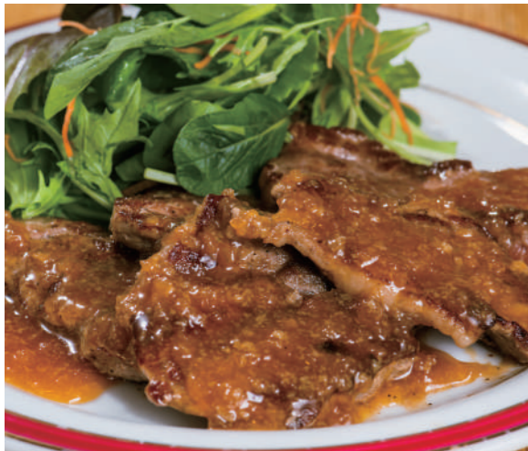
薄切りサーロインステーキ [140g]

フルビュッフェセット ¥1,200 (税込 ¥1,320) カレーライスセット ¥980 (税込 ¥1,078)