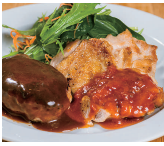
デミハンバーグ&炭焼きチキングリル

フルビュッフェセット ¥1,200 (税込 ¥1,320) カレーライスセット ¥980 (税込 ¥1,078)