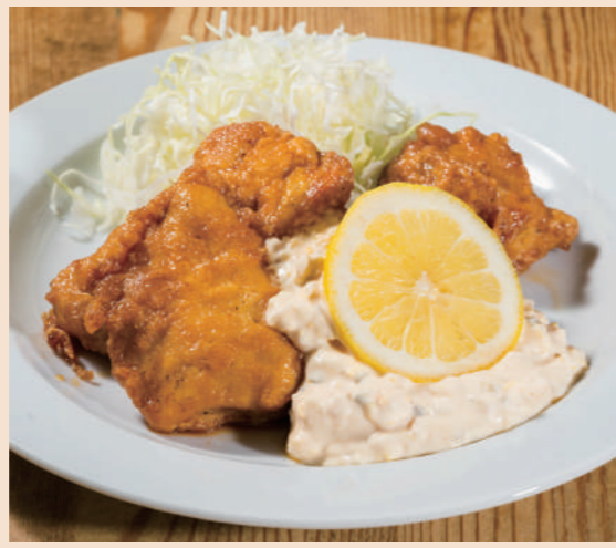
老舗洋食屋のチキン南蛮

フルビュッフェセット ¥1,200 (税込 ¥1,320) カレーライスセット ¥980 (税込 ¥1,078)