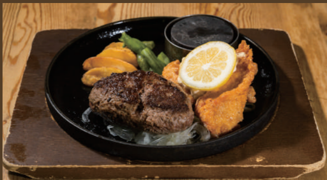
ブッチャーズハンバーグ [120g] & チキン南蛮

フルビュッフェセット ¥1,480 (税込 ¥1,628) カレーライスセット ¥1,260 (税込 ¥1,386)