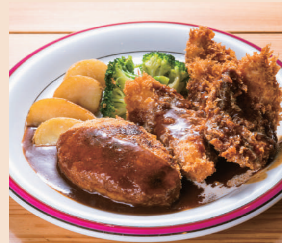
デミハンバーグ & チキンカツ

フルビュッフェセット ¥1,200 (税込 ¥1,320) カレーライスセット ¥980 (税込 ¥1,078)