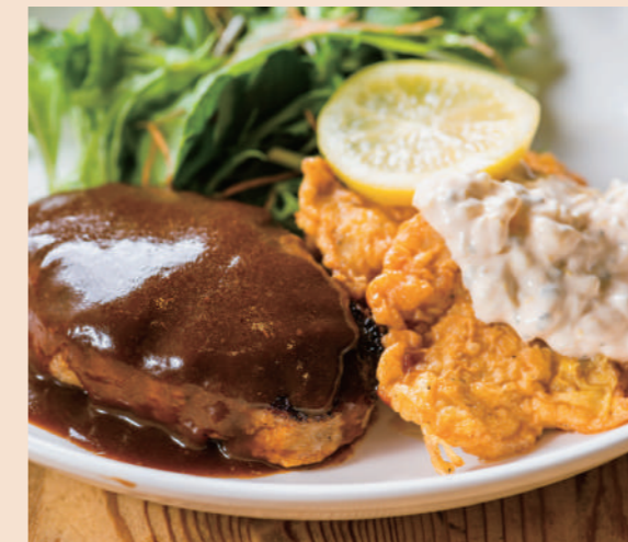
デミハンバーグ&チキン南蛮

フルビュッフェセット ¥1,200 (税込 ¥1,320) カレーライスセット ¥980 (税込 ¥1,078)