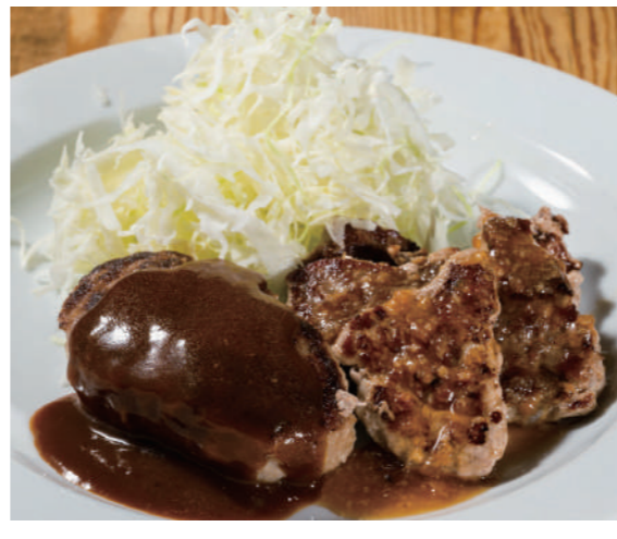
デミハンバーグ & 薄切りサーロイン

フルビュッフェセット ¥1,200 (税込 ¥1,320) カレーライスセット ¥980 (税込 ¥1,078)