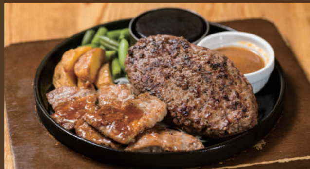
ブッチャーズハンバーグ [120g] & 薄切りサーロインステーキ

フルビュッフェセット ¥1,480 (税込 ¥1,628) カレーライスセット ¥1,260 (税込 ¥1,386)