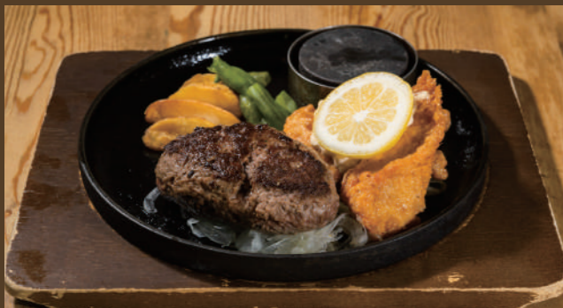
ブッチャーズハンバーグ [120g] & チキン南蛮

フルビュッフェセット ¥1,480 (税込 ¥1,628) カレーライスセット ¥1,260 (税込 ¥1,386)