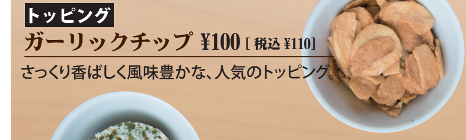
トッピング ガーリックチップ ¥100 [税込 ¥110] さっくり香ばしく風味豊かな、人気のトッピング。