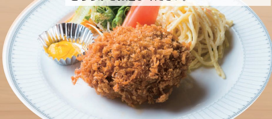
手仕込みメンチカツ