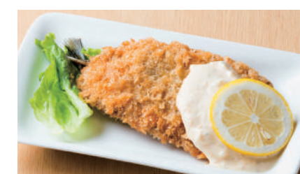
いわしフライ ¥450 [税込 ¥495]