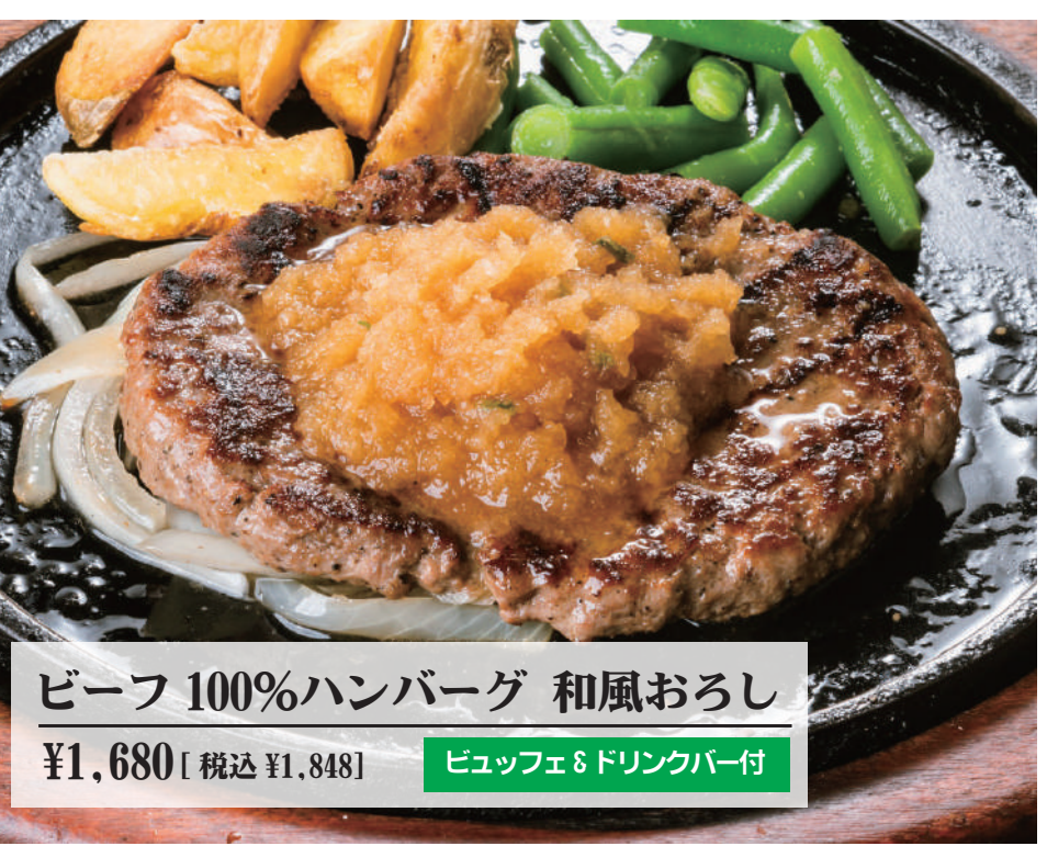
ビーフ 100%ハンバーグ 和風おろし ¥1,680 [税込 ¥1,848] ビュッフェ&ドリンクバー付