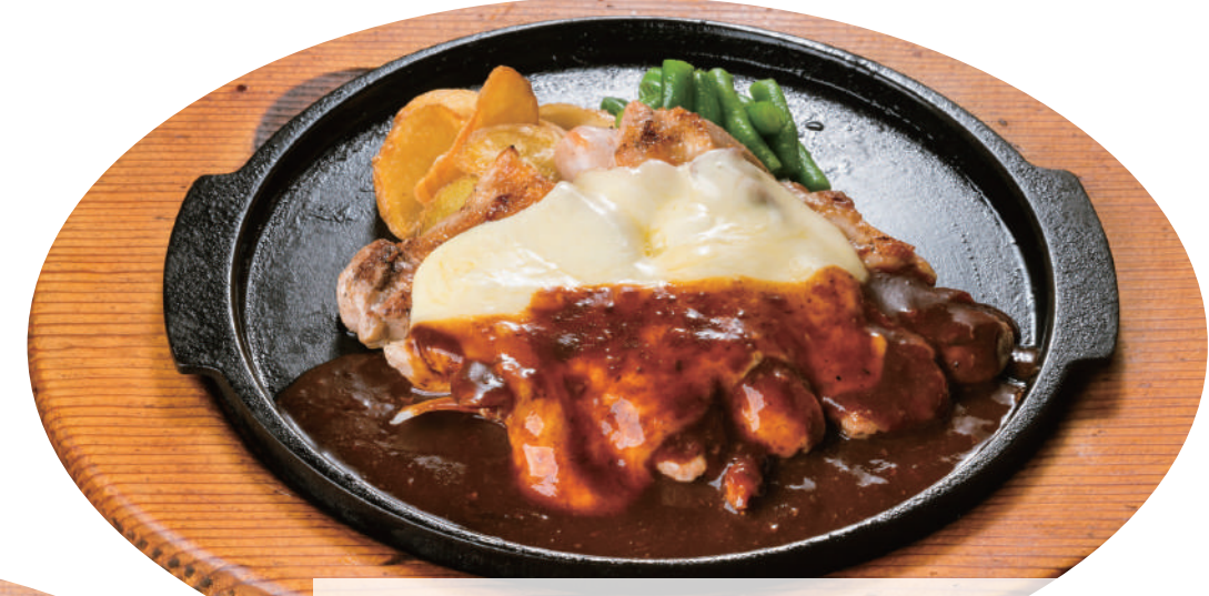
デミチーズチキングリル ¥1,380 [税込 ¥1,518] ビュッフェ&ドリンクバー付