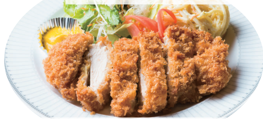
手仕込みチキンカツ