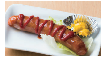
ビックフランク ¥450 [税込 ¥495]