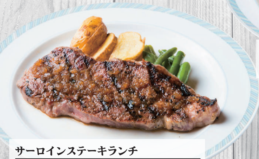
サーロインステーキランチ