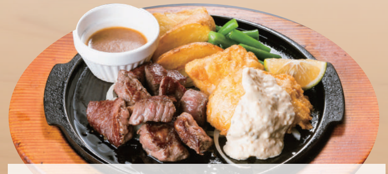
チキン南蛮&ジャポネカットステーキ ¥2,230 [税込 ¥2,453] ビュッフェ&ドリンクバー付

●プラス 100円 (税込 110円) で、ガーリックカットステーキに変更できます