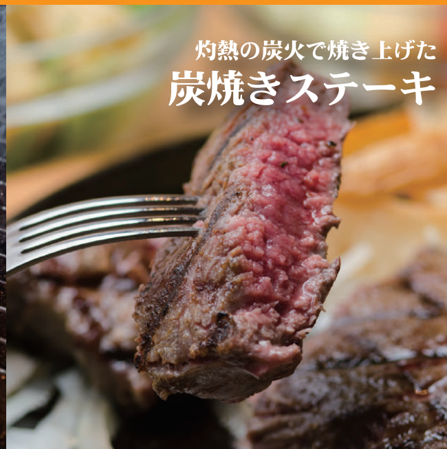
灼熱の炭火で焼き上げた 炭焼きステーキ