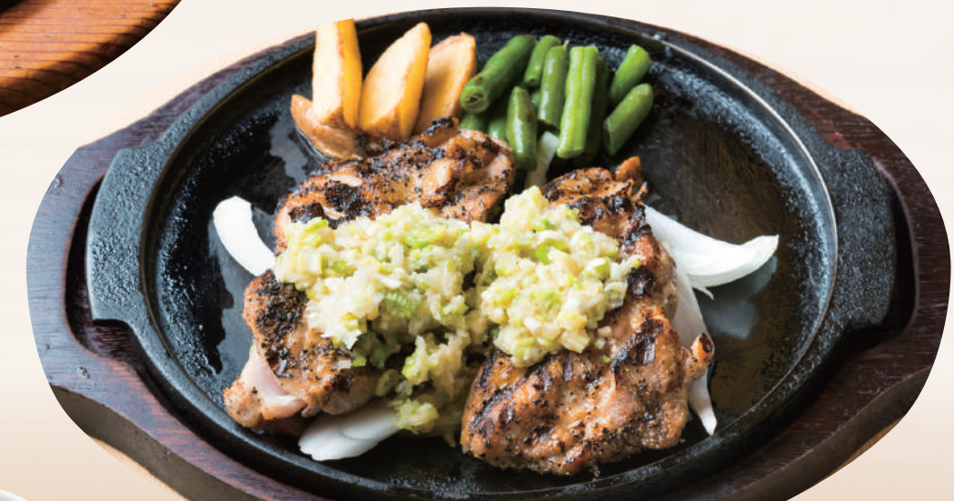
ネギ塩チキングリル ¥1,380 [税込 ¥1,518] ビュッフェ&ドリンクバー付