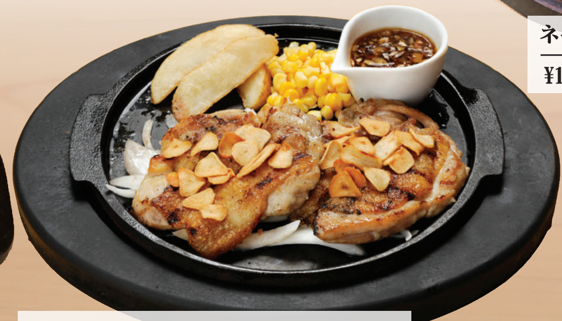
ガーリックチキングリル ¥1,380 [税込 ¥1,518] ビュッフェ&ドリンクバー付