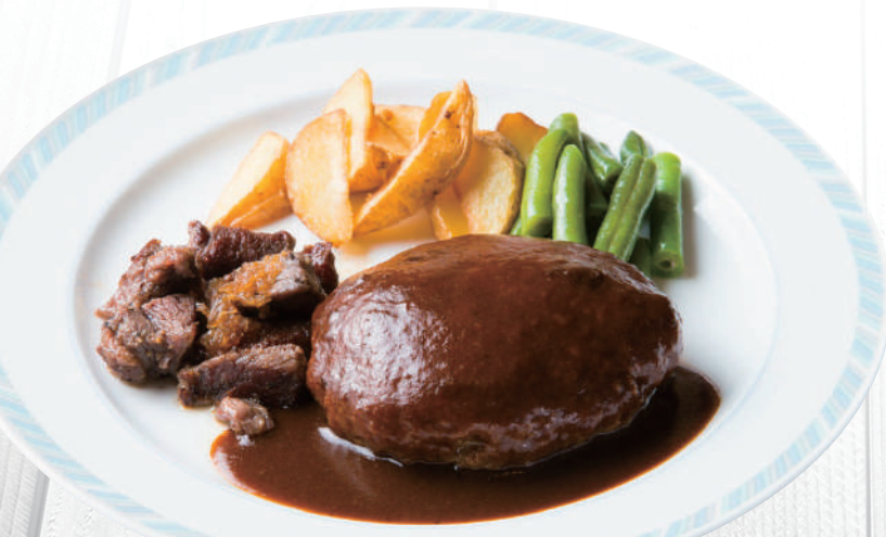
デミハンバーグ&カットステーキランチ