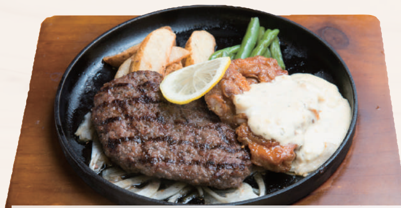
チキン南蛮&ビーフ 100%ハンバーグ ¥1,980 [税込 ¥2,178] ビュッフェ&ドリンクバー付

ソースをお選びください。 ジャポネソース ガーリックしょう油 テリヤキソース 香りボン酢