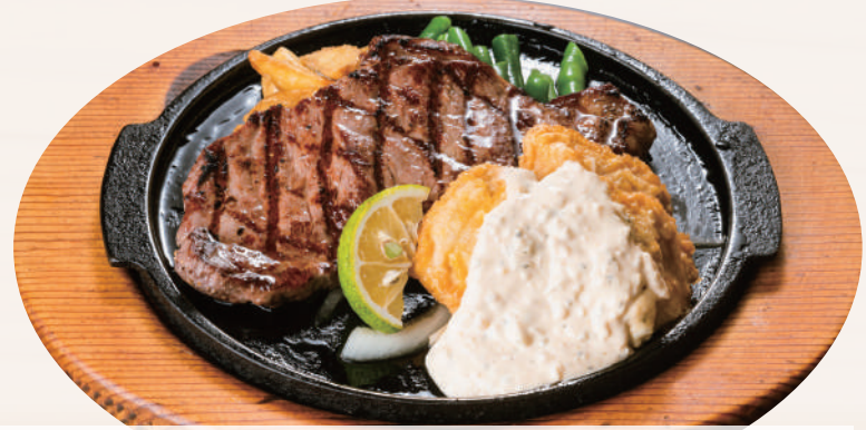
チキン南蛮&炭焼きサーロインステーキ ¥3,300 [税込 ¥3,630] ビュッフェ&ドリンクバー付

ソースをお選びください。 ジャポネソース ガーリックしょう油 テリヤキソース 香りボン酢