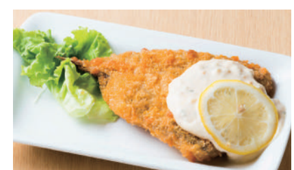
アジフライ ¥450 [税込 ¥495]