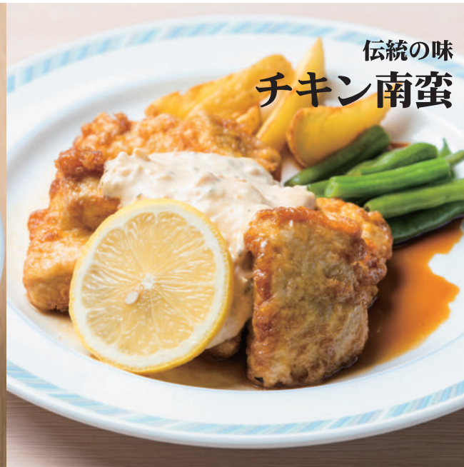
伝統の味 チキン南蛮