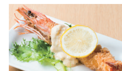
大海老フライ ¥550 [税込 ¥605]