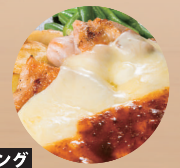
トッピング とろけるチーズ ¥150 [税込 ¥165] チキンとチーズのコンビネーション。