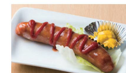
ビックフランク ¥450 [税込 ¥495]