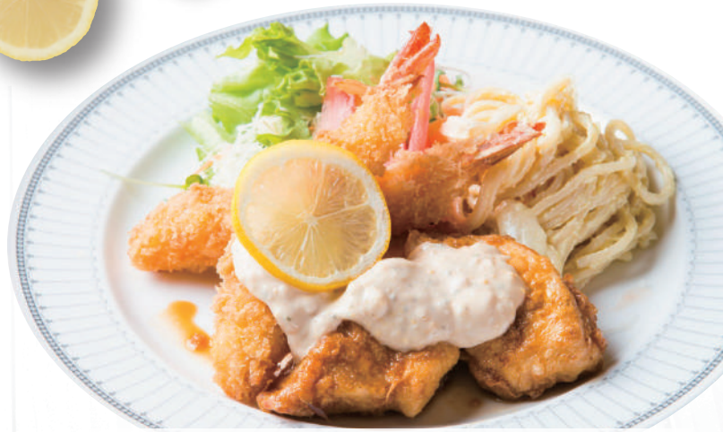
チキン南蛮&海老フライランチ