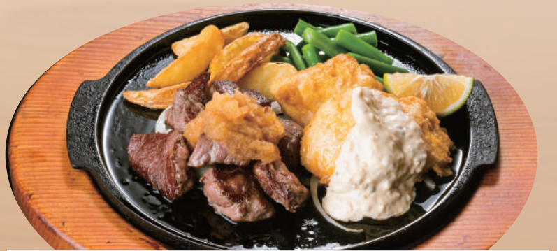
チキン南蛮&和風おろしカットステーキ ¥2,330 [税込 ¥2,563] ビュッフェ&ドリンクバー付

●プラス 100円 (税込 110円) で、ガーリックカットステーキに変更できます