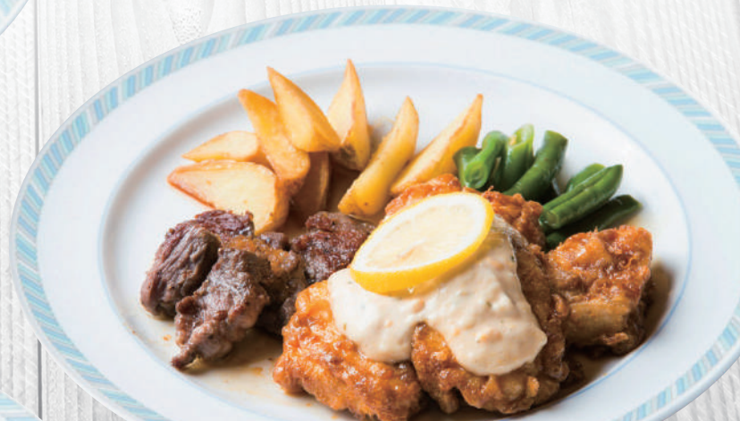
チキン南蛮&カットステーキランチ