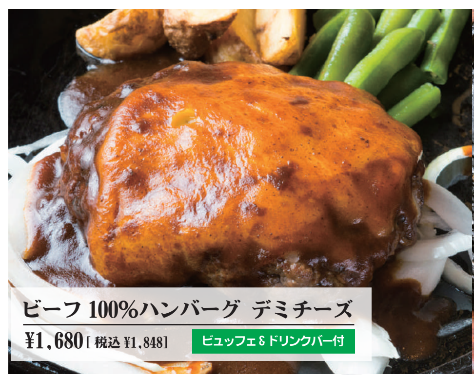
ビーフ 100%ハンバーグ デミチーズ ¥1,680 [税込 ¥1,848] ビュッフェ&ドリンクバー付

ソースをお選びください。 ジャポネソース ガーリックしょう油 テリヤキソース 香りボン酢