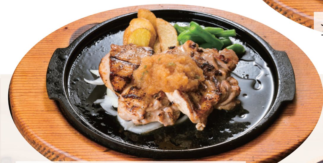
和風おろしチキングリル ¥1,380 [税込 ¥1,518] ビュッフェ&ドリンクバー付