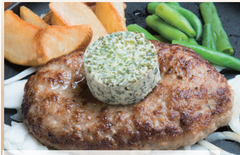
クラシックハンバーグ バジルバター