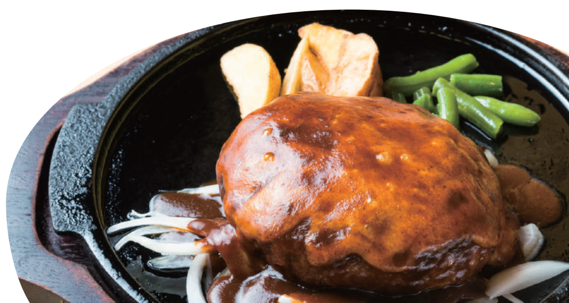
ジャンボクラシックハンバーグ チーズデミグラス