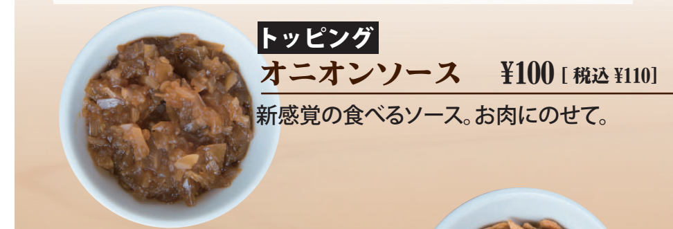
トッピング オニオンソース ¥100 [税込 ¥110] 新感覚の食べるソース。お肉にのせて。