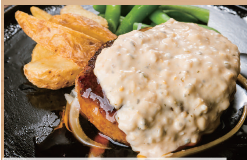
クラシックハンバーグ テリタルタル