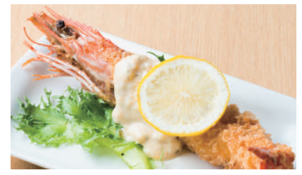
大海老フライ ¥550 [税込 ¥605]