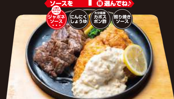
老舗洋食屋のチキン南蛮 & やわらかカットステーキ