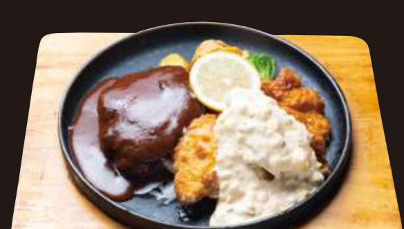
老舗洋食屋のチキン南蛮 & 手ごねハンバーグ