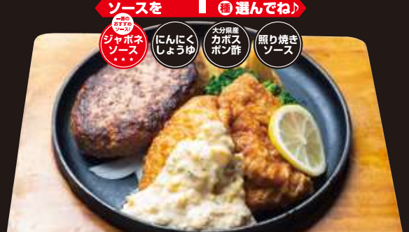
老舗洋食屋のチキン南蛮 & ブッチャーズハンバーグ