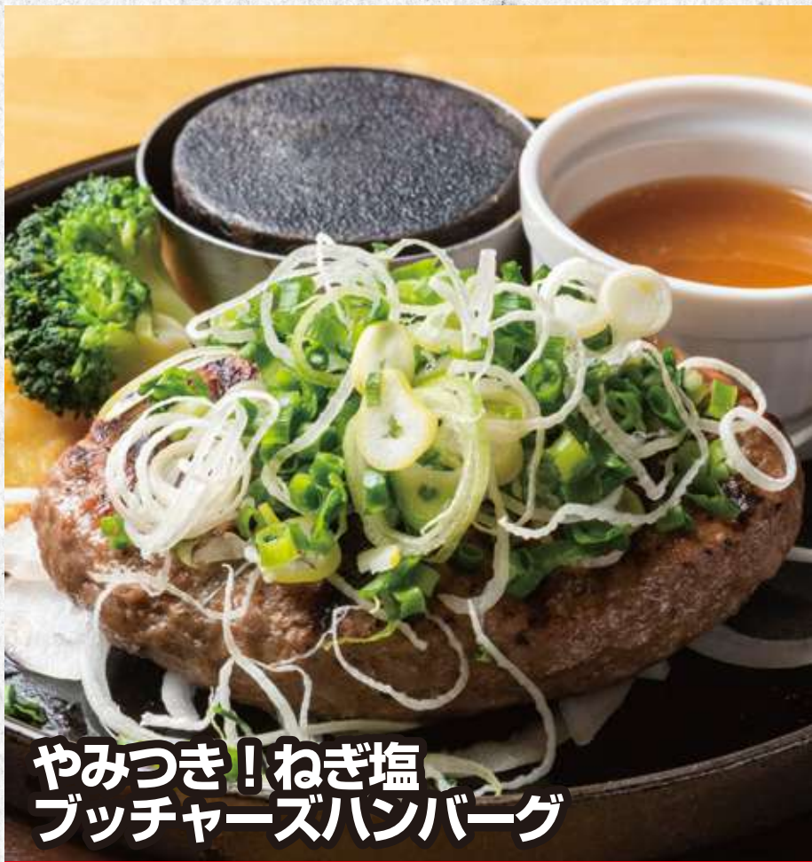
やみつき!ねぎ塩 ブッチャーズハンバーグ