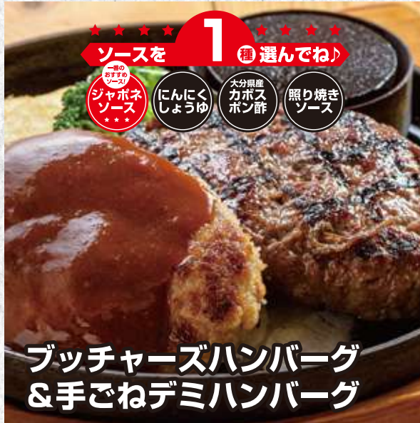
ブッチャーズハンバーグ &手ごねデミハンバーグ