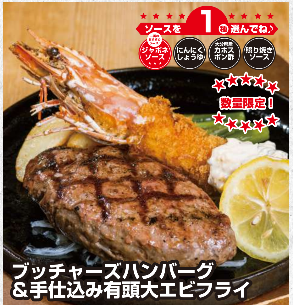
ブッチャーズハンバーグ &手仕込み有頭大エビフライ