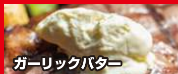
ガーリックバター