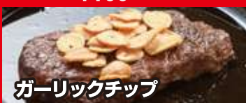
ガーリックチップ