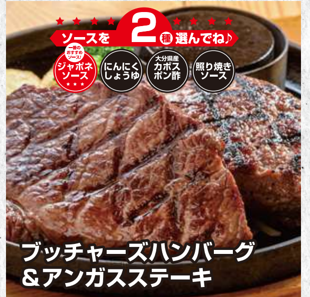
ブッチャーズハンバーグ &アングスステーキ