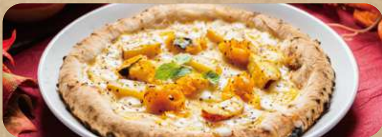
お芋とかぼちゃのスイート・ソルティピッツァ 蜂蜜やお芋の甘味と、チーズの塩味がクセになる美味しさ！