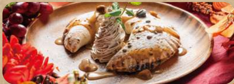
栗づくしのピッツァ モンテ・ピアンコ クリーム・ソース・フィリング、3種のマロンテイストを使用した秋のスイーツピッツァ！