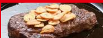
ガーリックチップ