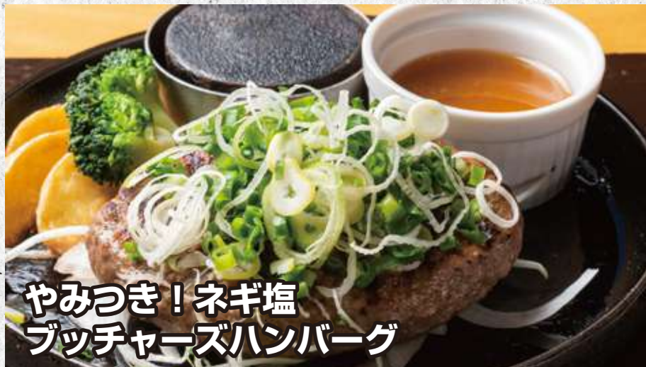
やみつき！ネギ塩 ブッチャーズハンバーグ