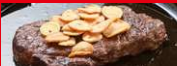
ガーリックチップ