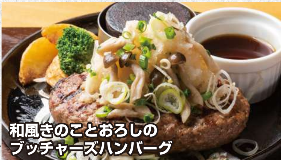
和風きのことおろしの ブッチャーズハンバーグ