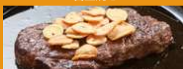
ガーリックチップ