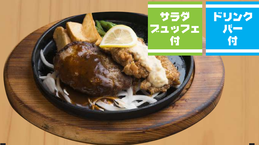
デミハンバーグ&チキン南蛮 1,500円 (税込1,650円)