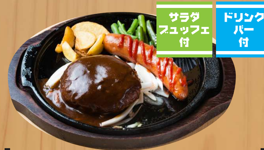
デミハンバーグ&ビックフランク 1,400円 (税込1,540円)