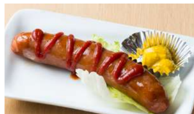
ビックフランク 300 円[税込330円]