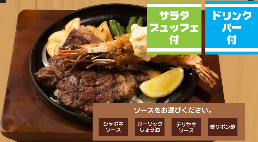
ステーキ&海老フライ 1,700円 (税込1,870円)