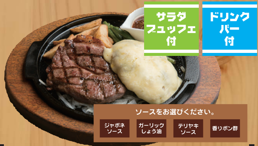
ステーキ&チーズハンバーグ 1,700円 (税込1,870円)