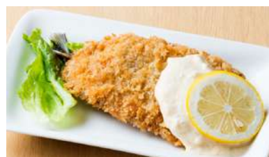
いわしフライ 300円 (税込330円)