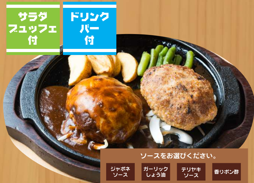
ダブルハンバーグ 1,780円 税込1,958円