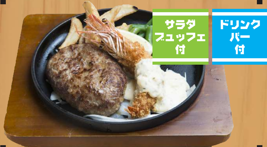
デミハンバーグ&海老フライ 1,500円 (税込1,650円)