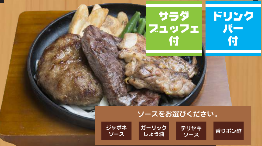
スーパートリオ(ステーキ、ハンバーグ & チキングリル) 1,900円 (税込2,090円)