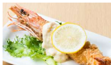
大海老フライ 400 円[税込440円]