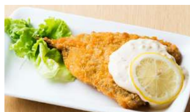
アジフライ 300円 (税込330円)