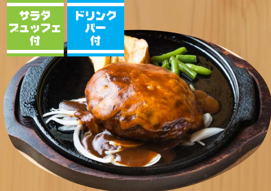
ジャンボチーズハンバーグ 1,600円 税込1,760円