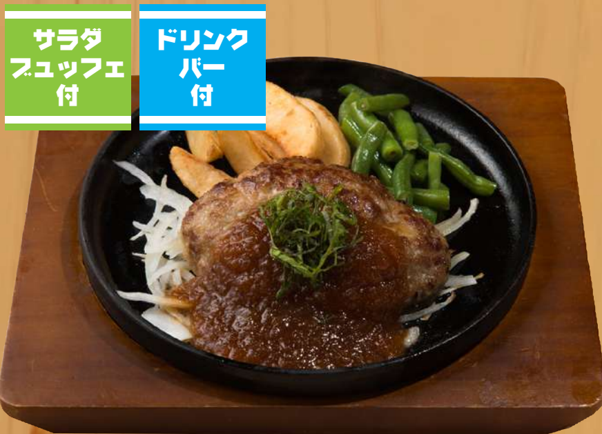
おろし和風ハンバーグ 1,200円 税込1,320円