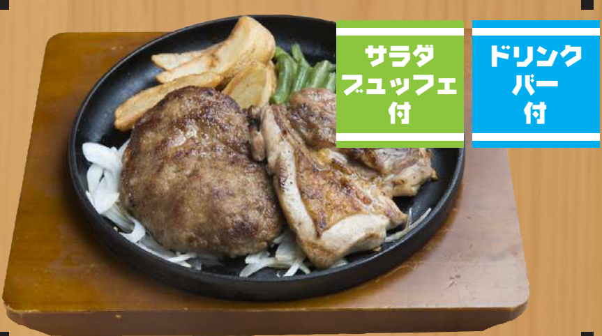
デミハンバーグ&チキングリル 1,500円 (税込1,650円)