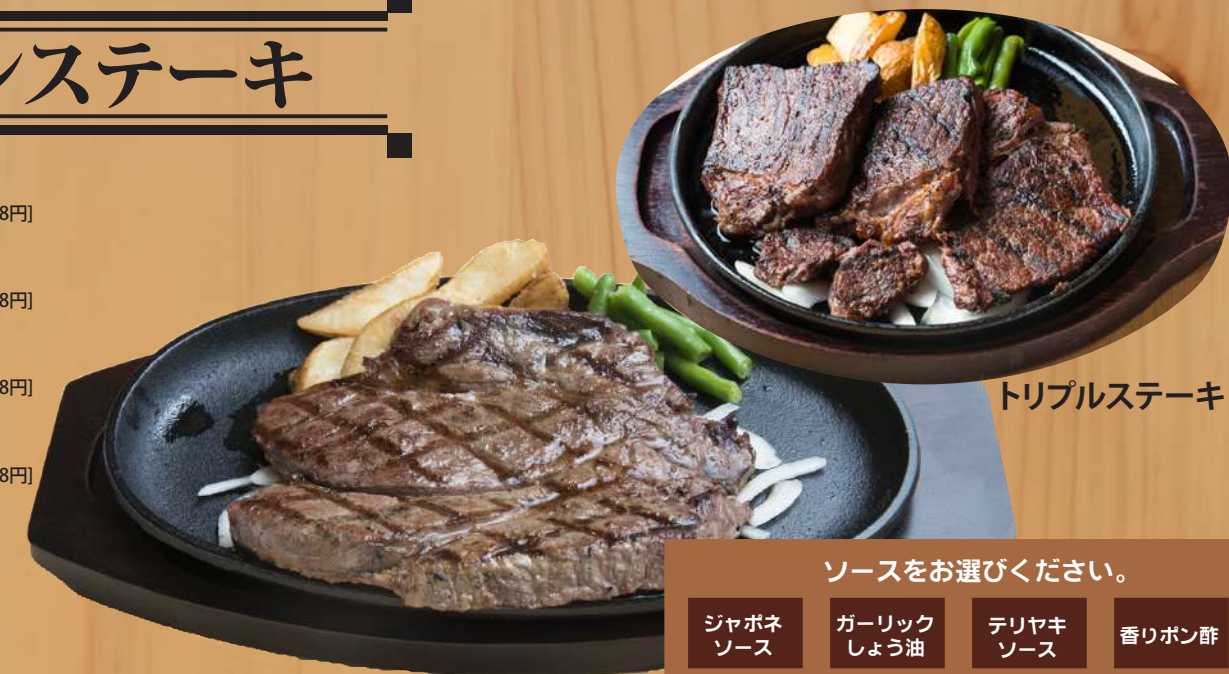
トリプルステーキ