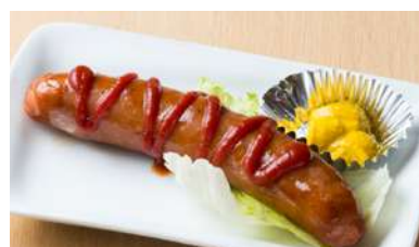
ビックフランク 300円 (税込330円)