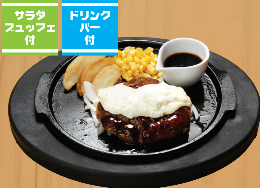
テリタルハンバーグ 1,300円 税込1,430円