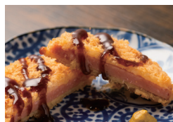
昭和のハムカツ 〔単品時価格 480円〕