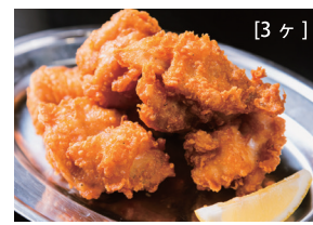
the トリカラ 〔秘伝和風ダレ漬け込み〕 〔単品時価格 580円〕