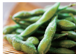
枝豆 〔単品時価格 200円〕