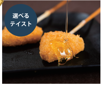
カマンベール串揚げ プレーン or ハニーベッパー 〔単品時価格 1本 180円〕