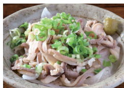
酢もつ 〔単品時価格 380円〕