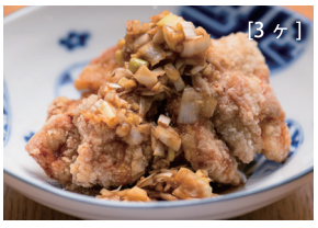
ユーリンチー 〔ネギにんにく香味だれ!〕 〔単品時価格 580円〕