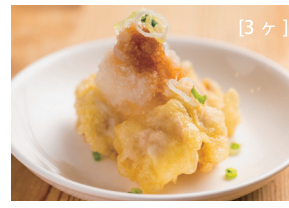
とり天 かぼすおろし 〔大分名物!!〕 〔単品時価格 480円〕