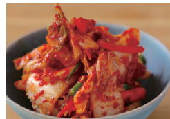
白菜キムチ 〔単品時価格 380円〕