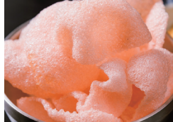
揚げたてえびせん 〔単品時価格 200円〕