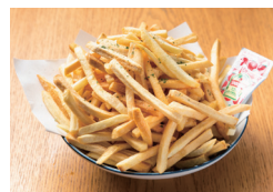
フライドポテト 〔単品時価格 380円〕