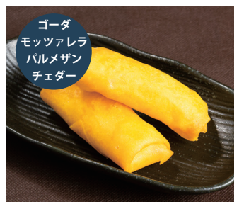
クワトロチーズロール〔2本〕 〔単品時価格 480円〕