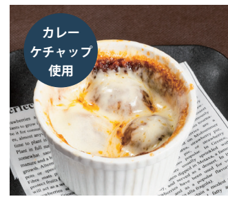
チーズミートボール 〔単品時価格 480円〕