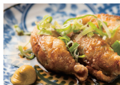
鶏皮ギョウザ 〔単品時価格 480円〕