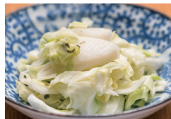
浅漬けサラダ 〔単品時価格 380円〕