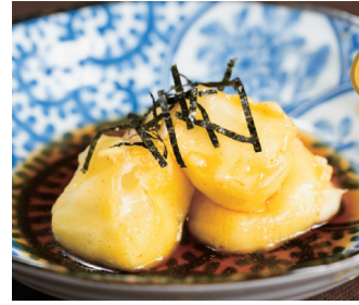
チーズたら おつまみ揚げ出し 〔単品時価格 480円〕