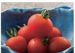
トマトサラダ 〔単品時価格 380円〕