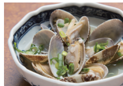
あさりのにんにく蒸し 〔単品時価格 480円〕