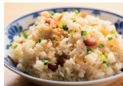
ガーリックライス 〔単品時価格 580円〕