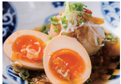
麻葉玉子〔1/2ヶ〕 〔単品時価格 380円〕