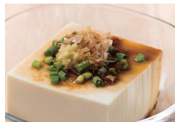
ひややっこ 〔単品時価格 200円〕