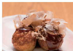
浪花のたこ焼き 〔単品時価格 480円〕