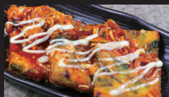
チーズ揚げチヂミ