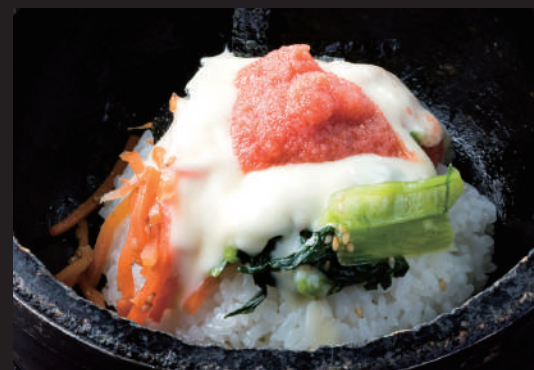
石焼ビビンバ明太チーズ