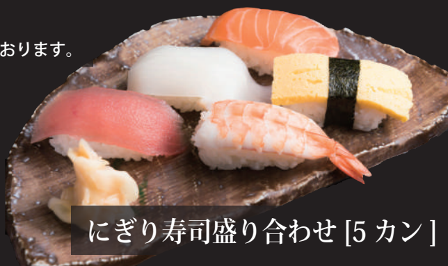
にぎり寿司盛り合わせ [5 かん]