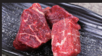
角切りカルビ [スパイス塩]