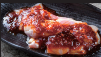
せせり [タレ・スパイス塩・赤辛]