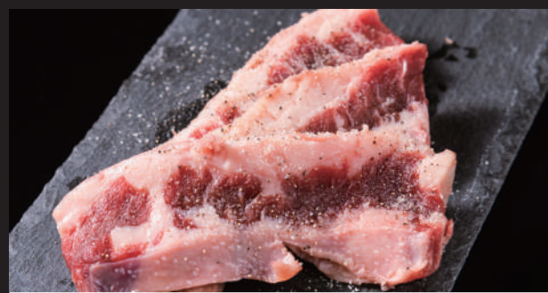
カルビ [スパイス塩]