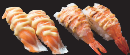
サーモンチーズ 海老チーズ