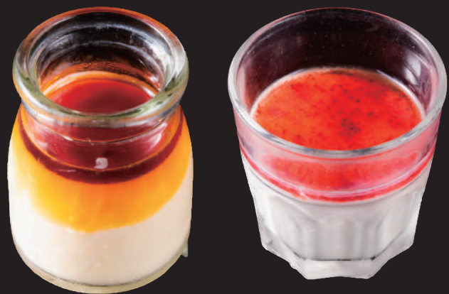
なめらかキャラメルプリン 濃厚 杏仁豆腐