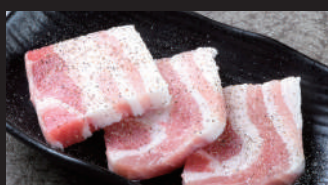
テジカルビ [タレ・スパイス塩]