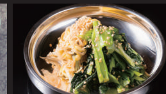
国産野菜のナムル