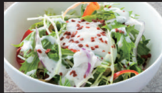
温玉シーザーサラダ