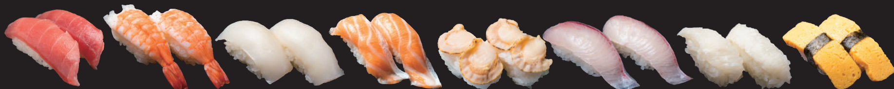
まぐろ 海老 いか サーモン ほたて かんぱち えんがわ 玉子