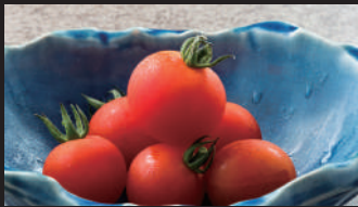
県産朝採れミニトマト