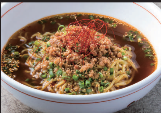
台湾ラーメン (大・ハーフ)