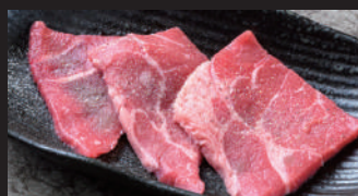
ロース [スパイス塩]