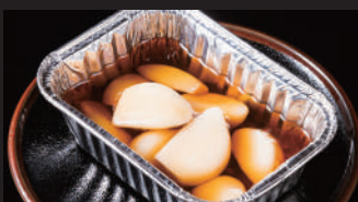
にんにくホイル焼