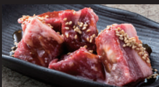
角切りカルビ [タレ]