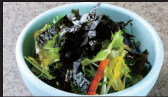
のりのりコレギサラダ