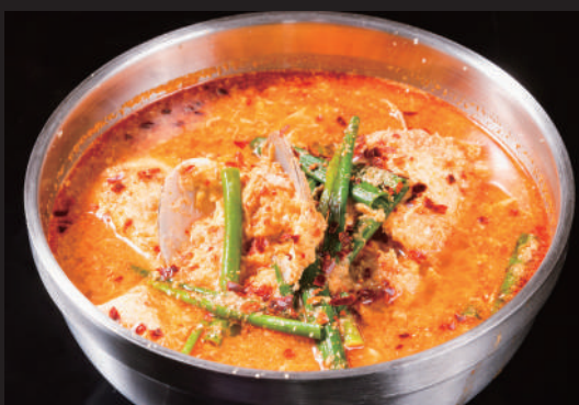
スンドゥブチゲ (韓国風旨辛豆腐スープ)