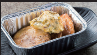
じゃがバターホイル焼