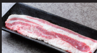
バラカルビ [スパイス塩]