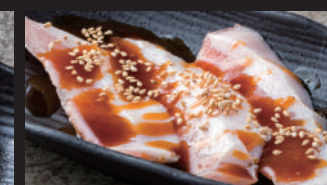
ピートロ [タレ・スパイス塩]