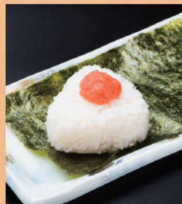
おにぎり【明太子・鮭】