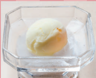
柚子シャーベット