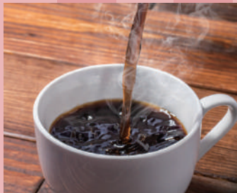
ホットコーヒー [セルフ]