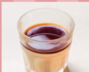
キャラメルプリン