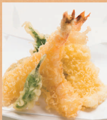
天ぷら盛り合わせ