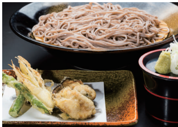
蕎麦 [ざる or かけ] と 牡蠣と季節野菜の天ぷらセット