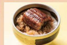
うなぎ (小) 香の物付 582 円 [税込 640 円]