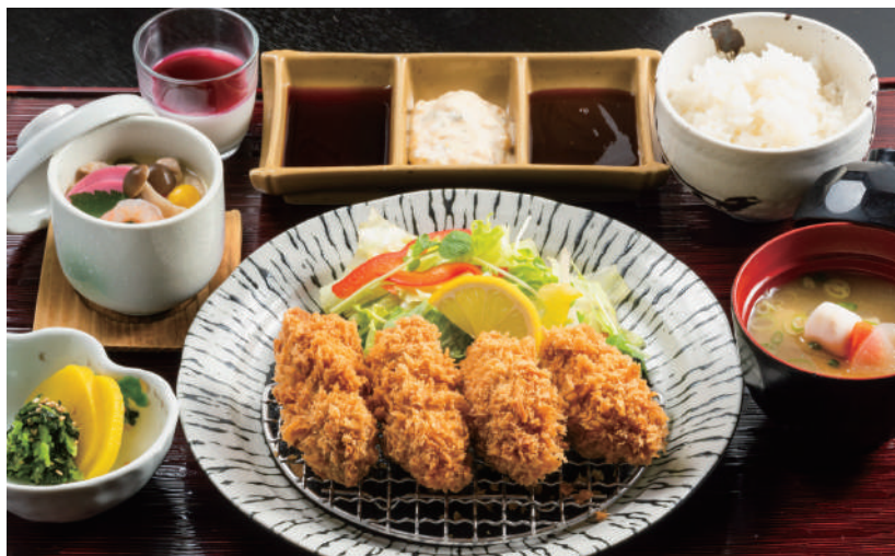
大粒カキフライ御膳 1,580 円 [税込 1,738 円]