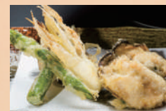
牡蠣と季節野菜の天ぷら 500 円 [税込 550 円]