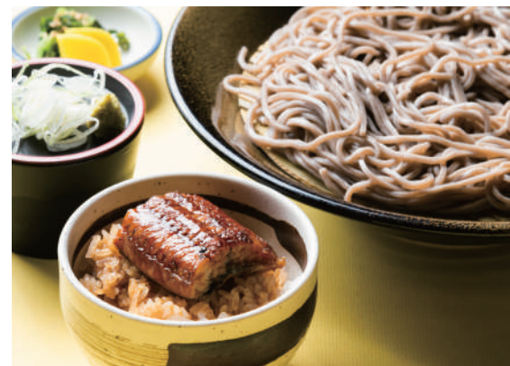
蕎麦 [ざる or かけ] とうなぎ (小) のセット