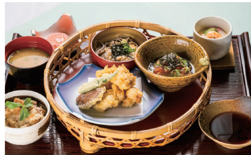
豊後郷土料理御膳 1,600 円 [税込 1,760 円]

りゅうきゅう / とり天 / しいたけ天 / とろろ蕎麦 / 鶏めし / 茶碗蒸し / 一口甘味