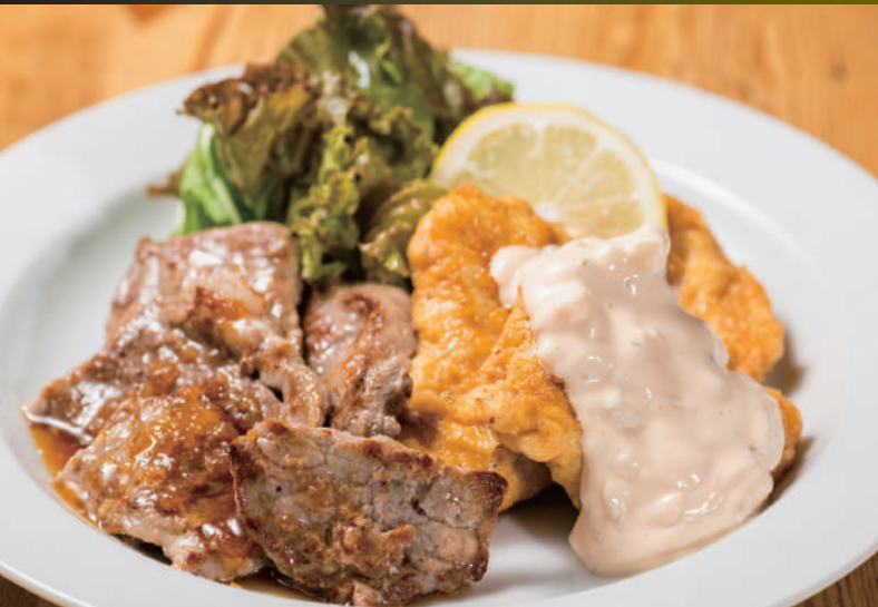
オニオンソースの薄切りサーロイン & チキン南蛮