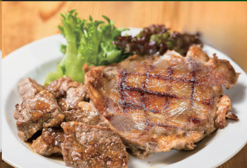
オニオンソースの薄切りサーロイン & グリルチキン