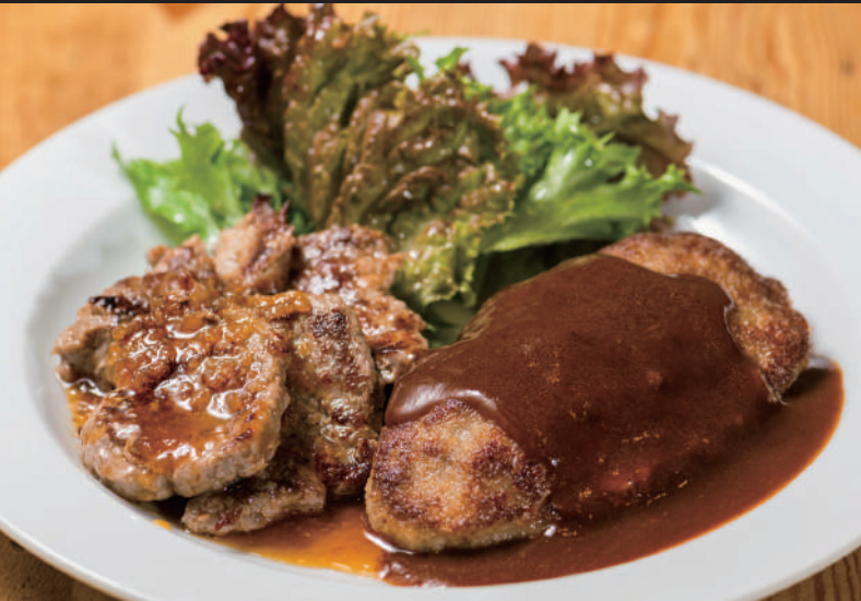
オニオンソースの薄切りサーロイン & デミ三ツ星ハンバーグ