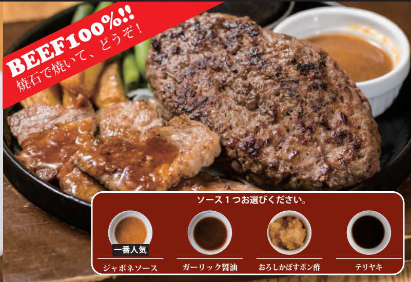
オニオンソースの薄切りサーロイン & 黒毛和牛ビーフ100%ハンバーグ(150g)