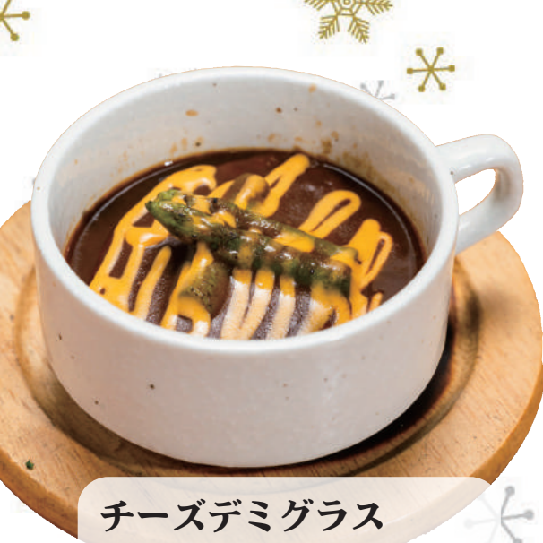
チーズデミグラス ハンバーグ