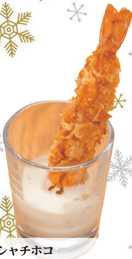
シャチホコ 海老フリヤー (1 本)