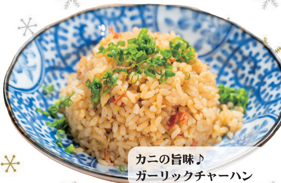
カニの旨味♪ ガーリックチャーハン