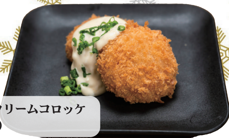
うにクリームコロッケ (2 ケ)