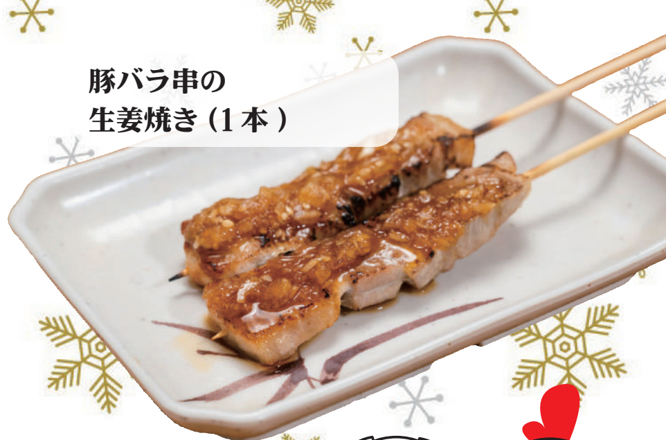
豚バラ串の 生姜焼き (1 本)