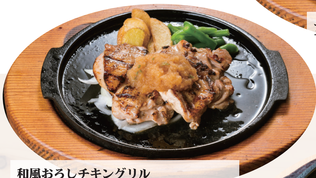
和風おろしチキングリル ¥1,530 [税込 ¥1,683] ビュッフェ&ドリンクバー付