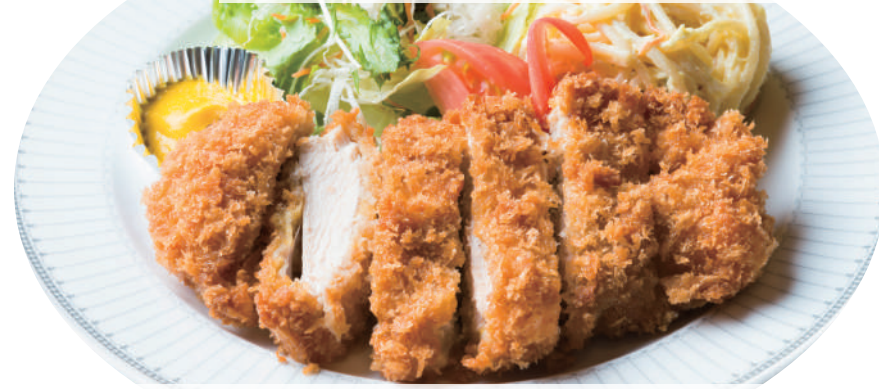
手仕込みチキンカツ