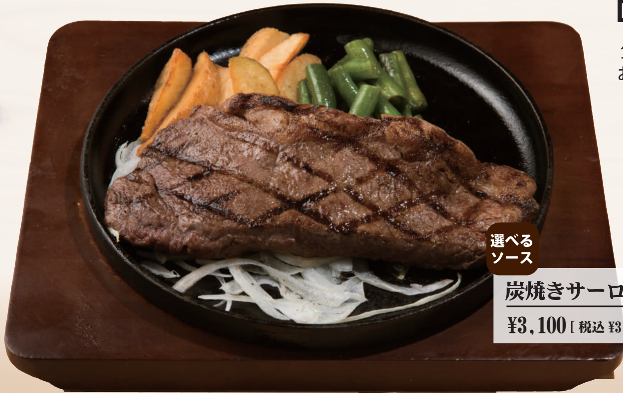
選べるソース 炭焼きサーロインステーキ レギュラー ¥3,100 [税込 ¥3,410] ステーキ 180g

トッピング バジルバター ¥200 [税込 ¥220] お肉にのせると、溶けて香りが広がります。