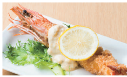
大海老フライ ¥630 [税込 ¥693]