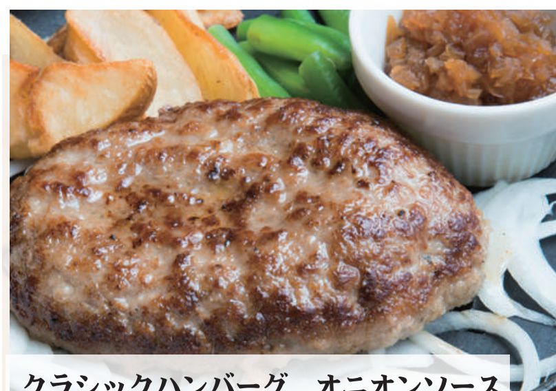
クラシックハンバーグ オニオンソース