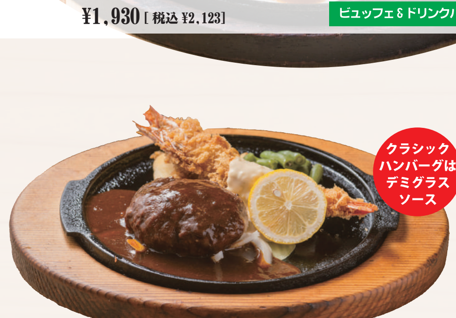
クラシックデミハンバーグ&大海老フライ