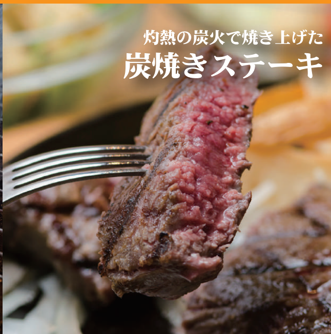
灼熱の炭火で焼き上げた 炭焼きステーキ