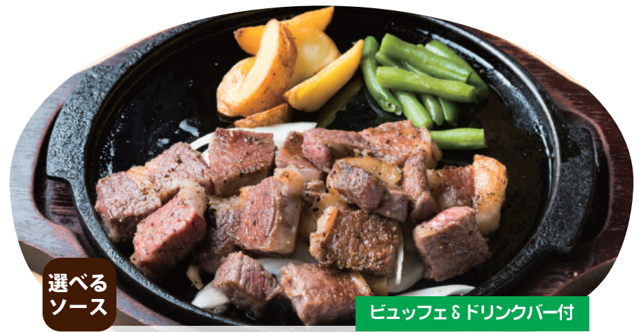
選べるソース 炭焼き黒毛和牛ステーキ 一口カット ¥4,700 [税込 ¥5,170] ステーキ 200g