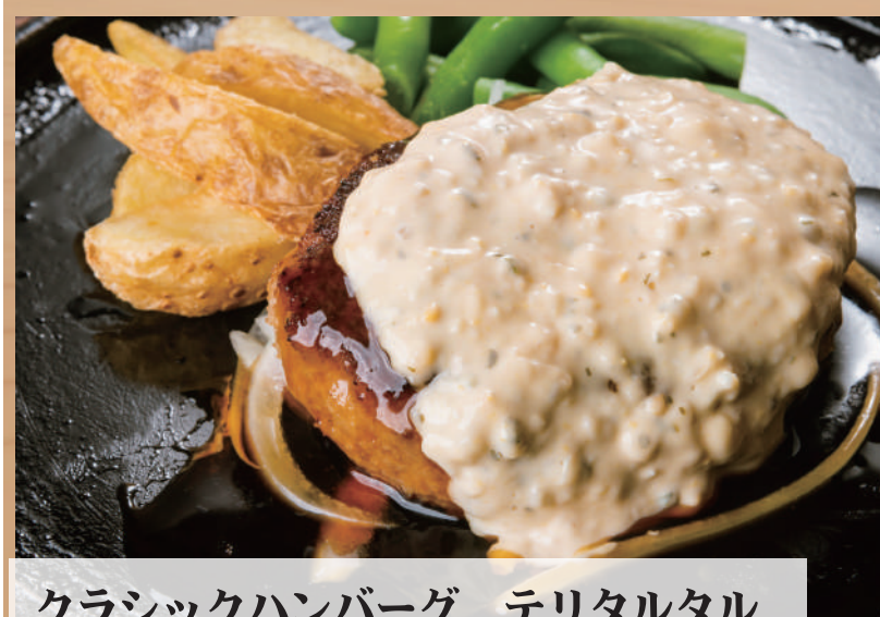
クラシックハンバーグ テリタルタル