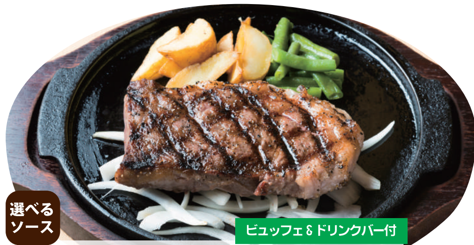
選べるソース 炭焼き黒毛和牛ステーキ レギュラー ¥4,700 [税込 ¥5,170] ステーキ 200g

選べるソース ... このマークがついている商品は、ソースを右下からお選びください。 プレミアムステーキ