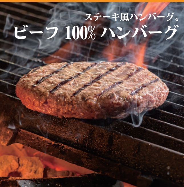
ステーキ風ハンバーグ。 ビーフ 100% ハンバーグ