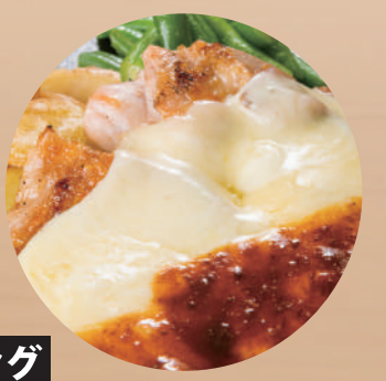
トッピング とろけるチーズ ¥200 [税込 ¥220] チキンとチーズのコンビネーション。