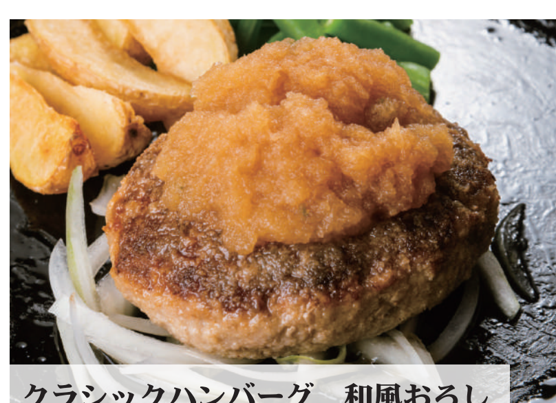
クラシックハンバーグ 和風おろし