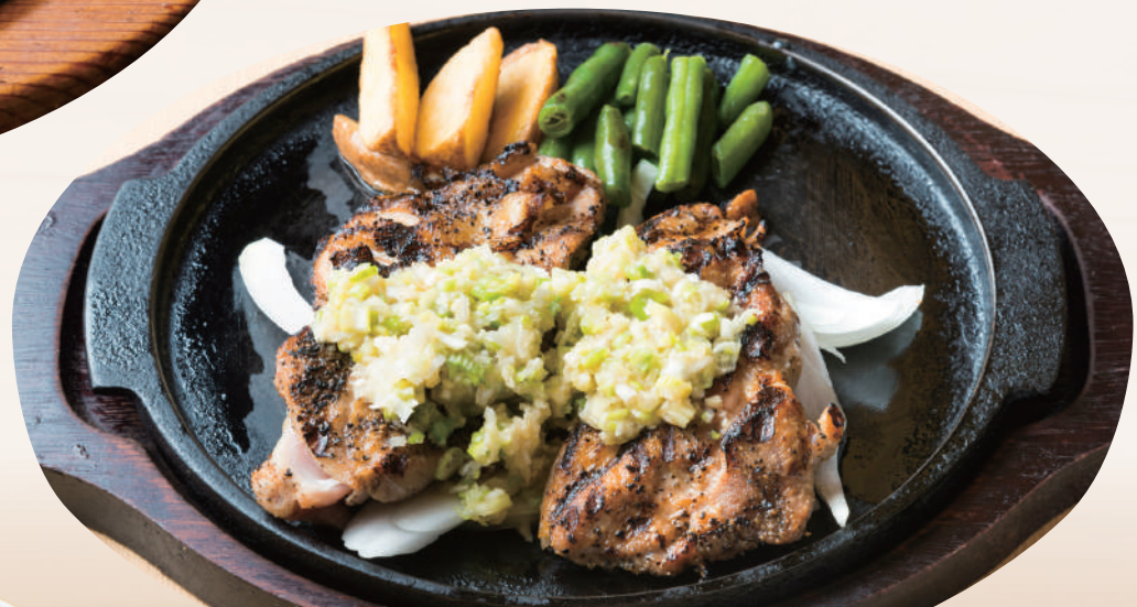
ネギ塩チキングリル ¥1,530 [税込 ¥1,683] ビュッフェ&ドリンクバー付