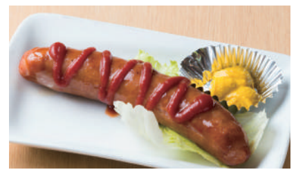
ビックフランク ¥500 [税込 ¥550]