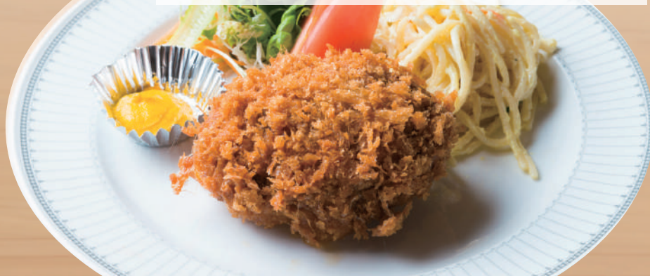
手仕込みメンチカツ