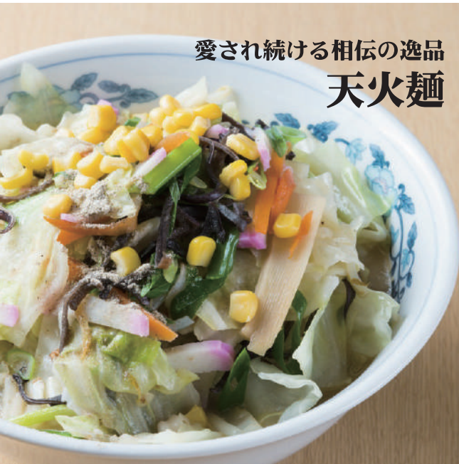
愛され続ける相伝の逸品 天火麺