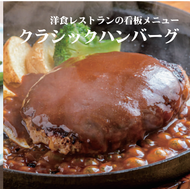
洋食レストランの看板メニュー クラシックハンバーグ