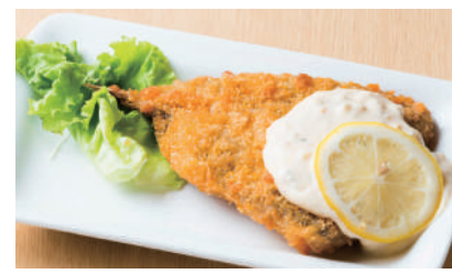
アジフライ ¥480 [税込 ¥528]