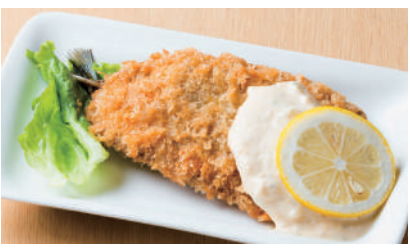
いわしフライ ¥480 [税込 ¥528]