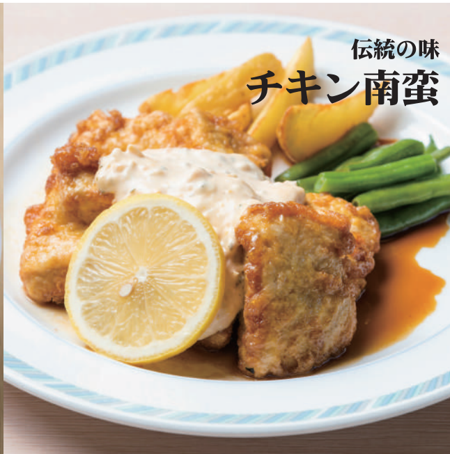
伝統の味 チキン南蛮