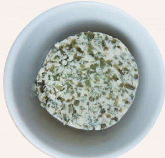
ビュッフェ&ドリンクバー付

トッピング バジルバター ¥200 [税込 ¥220] お肉にのせると、溶けて香りが広がります。