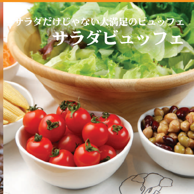
サラダだけじゃない大満足のビュッフェ サラダビュッフェ