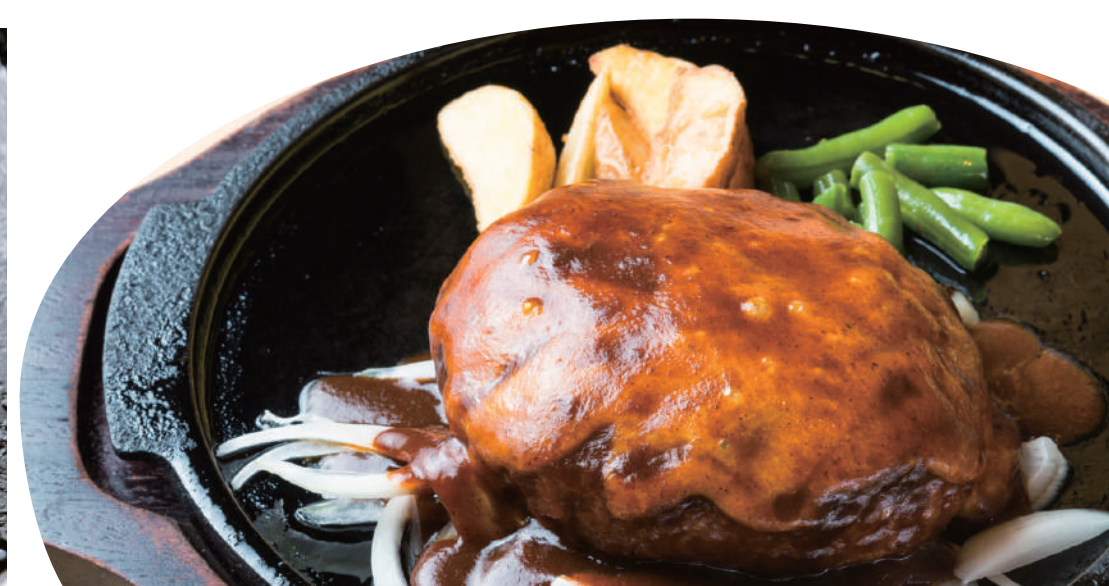
ジャンボクラシックハンバーグ チーズデミグラス