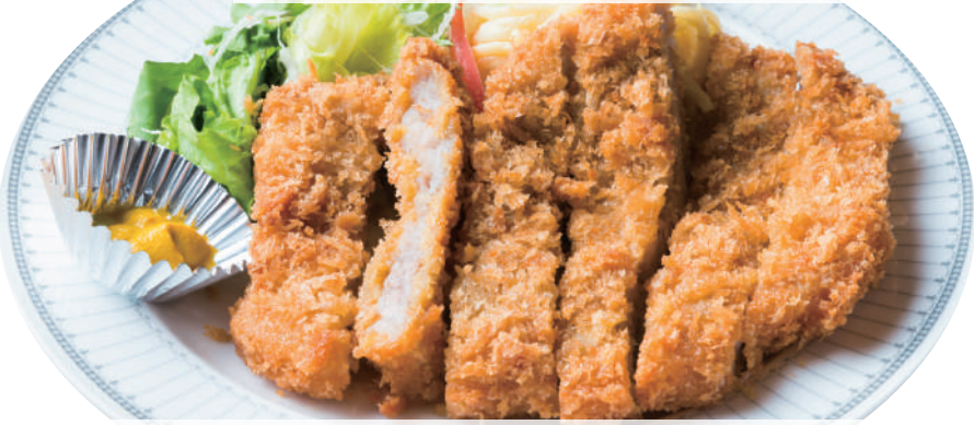
手仕込みロースカツ