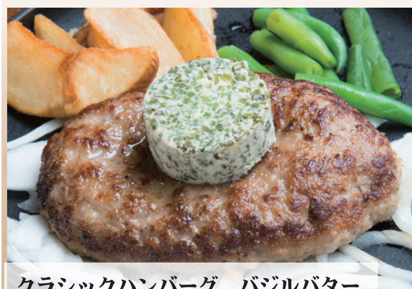
クラシックハンバーグ バジルバター