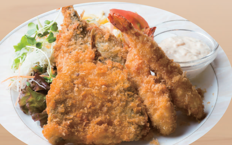
手仕込みミックスフライ[海老・イワシ・アジ]