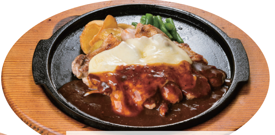
デミチーズチキングリル ¥1,530 [税込 ¥1,683] ビュッフェ&ドリンクバー付