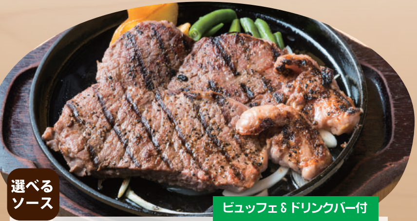
選べるソース 炭焼きサーロインステーキ ダブル ¥4,200 [税込 ¥4,620] ステーキ 180g×2 枚