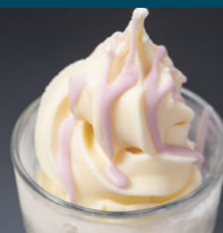
パリパリ 苺の ソフトクリーム