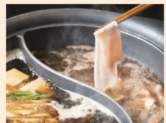
2 種のだしでいただく 絶品豚しゃぶ。