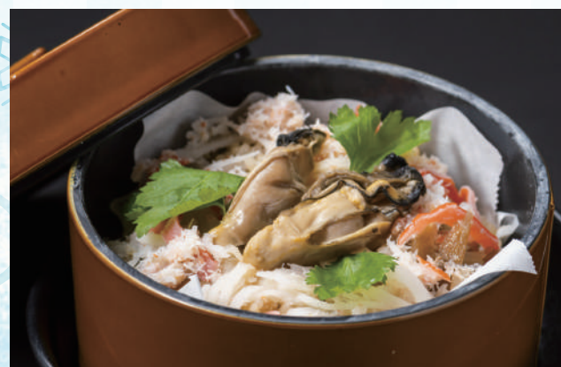
牡蠣と蟹の蒸籠ごはん