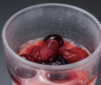
ベリーたっぷり 苺 フリン