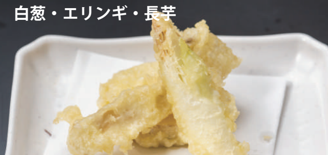
白葱・エリンギ・長芋