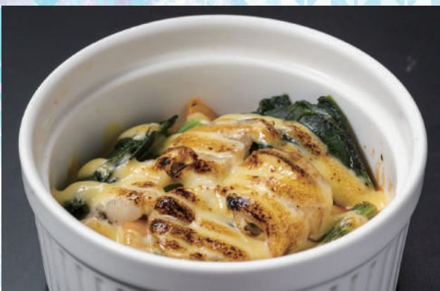
帆立とホウレン草の クリームグラタン