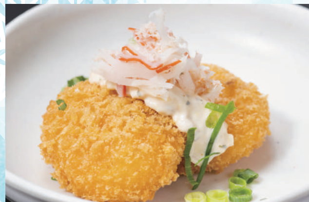
カニクリームコロッケ