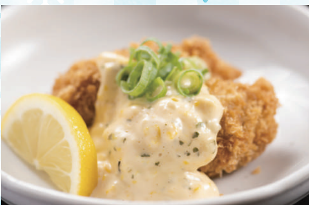
広島産牡蠣フライ