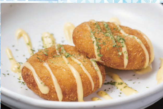
もっチーズポテトモチ