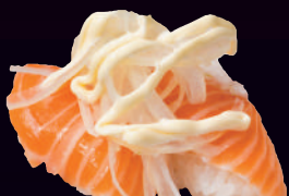
サーモン鬼オニオン