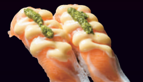
サーモンバジルチーズ