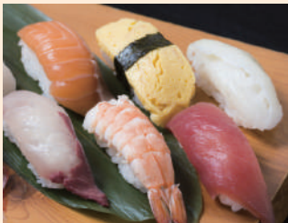
人気のにぎり寿司