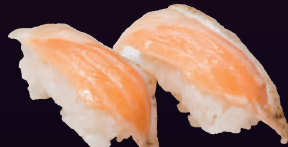
炙りハラスサーモン