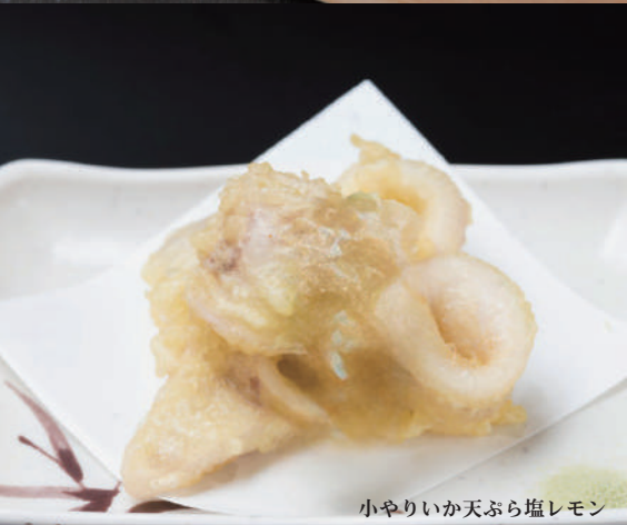
小やういか天ぷら塩レモン