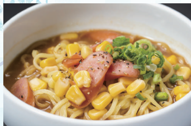
濃厚味噌バターコーンラーメン