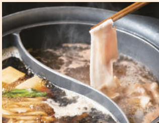
2 種のだしでいただく 絶品豚しゃぶ。