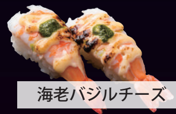
海老バジルチーズ