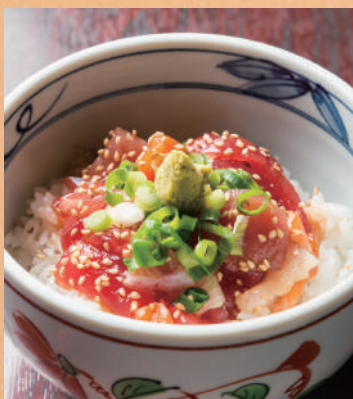
りゅうきゅう丼 (小)