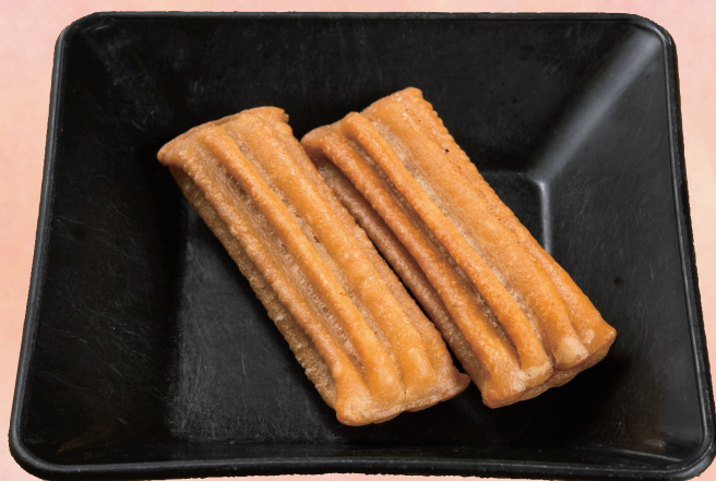
カスタードチュロス