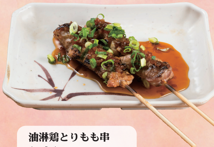
油淋鶏とりもも串 (1本)